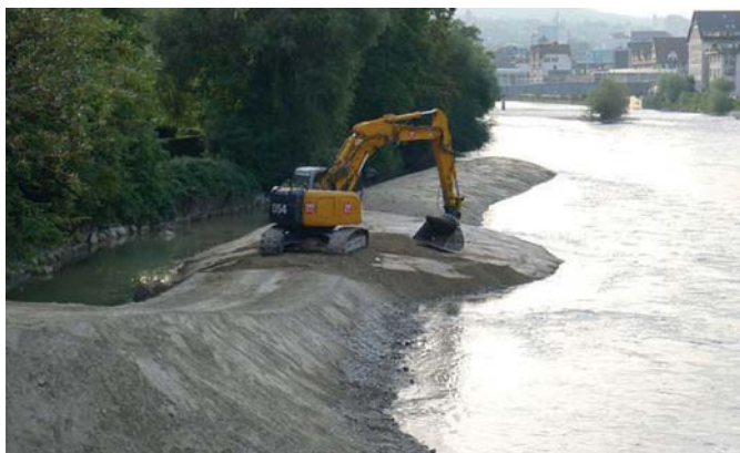
Bild 2. Kiesschüttung Breitensteinstrasse in der Limmat. Blick gegen die Fliessrichtung.

durchgeführt, um die im Labor gemessenen Erosionsraten zu reproduzieren. Die Arbeit vertieft das Grundlagenwissen zum Prozess der Seitenerosion und dessen Parametrisierung für die Prognose mittels numerischer Simulation. Zusätzlich soll für die Praxis aufgezeigt werden, wie Einbauten bzw. Kiesschüttungen optimal ausgeführt werden können (z.B. Ort und Art der Zugabe, Häufigkeit der Erneuerungen), damit sie effizient Seitenerosionsprozesse auslösen und gleichzeitig als Geschiebedepot dienen.